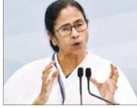
কর্মীদের ভ্যাকসিন দিয়ে কাজ শুরু করতে চায়,

নিজস্ব প্রতিবেদন: করোনা মোকাবেলায় বাংলায় বিধিনিষেধে কিছুটা ছাড় দেওয়া হল। কার্যত লকডাউনে আংশিক ছাড় ঘোষণা করলেন মুখ্যমন্ত্রী মমতা বন্দ্যোপাধ্যায়। আগামী ১৫ জুন পর্যন্ত রাজ্যে কড়া বিধিনিষেধের ঘোষণা করা হয়েছিল। তবে এবার তা কিছুটা লাঘব করল রাজ্য সরকার। আংশিক ছাড় দেওয়া হচ্ছে খুচরো দোকানকে। সোমবার নবান্নে সাংবাদিক বৈঠকে মুখ্যমন্ত্রী ঘোষণা করলেন বেলা ১২টা থেকে ৩টে পর্যন্ত খুচরো বাজারের (রিটেল মার্কেট) দোকান খোলা থাকবে। তথ্য প্রযুক্তি ক্ষেত্রে ১০ শতাংশ কর্মী কাজ করতে পারবেন। কোনও নির্মাণ সংস্থা যদি নিজেদের