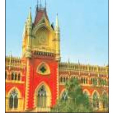
ছাড়াদের ফেরানো হবে বলে উল্লেখ করা হয়েছে। পরিচয়পত্র দেখার পরেই ঘরে ফেরানো হবে সংশ্লিষ্ট ব্যক্তিদের।

নিজস্ব প্রতিবেদন: সবদিক বিবেচনা করে ভোট পরবর্তী হিংসার ঘটনায় পদক্ষেপ করল কলকাতা হাই কোর্ট। বিধানসভা নির্বাচন পরবর্তী হিংসা নিয়ে জলখোলা কম হয়নি। ভোট পরবর্তী অশান্তির জেরে ঘর ছাড়া মানুষদের ফেরাতে এবার নতুন কমিটি গঠন করল কলকাতা হাইকোর্টের বৃহত্তর বেঞ্চ। ভোট পরবর্তী হিংসা নিয়ে বড় রায় দিল কলকাতা হাইকোর্ট। মঙ্গলবার সকাল ১১টার মধ্যে এই কমিটি গড়তে হবে। জানানো হবে কত মানুষ ঘরে ফিরতে পারেননি। এই কমিটিতে থাকবেন রাজ্য ও কেন্দ্রের মানবাধিকার কমিশনের সদস্য ও রাজ্য লিগ্যাল সার্ভিস কমিটির সদস্য।