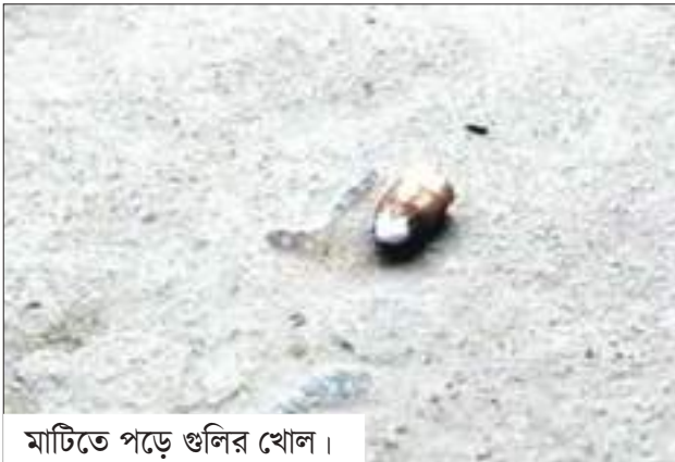
মাটিতে পড়ে গুলির খোল।

ষষ্ঠ দফার ভোটগ্রহণ শুরুর কয়েক ঘণ্টা আগে বুধবার গভীর রাতে গুলি চলল উত্তর দিনাজপুর জেলার চোপড়া বিধানসভা এলাকায়। সেখানকার চুটিয়াখোর এলাকায় গভীর রাতে বাইকবাহিনী তাণ্ডব চালিয়েছে