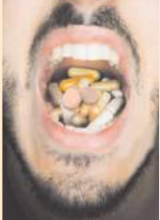
সি ট্যাবলেট খেলে বুক জ্বালা

হওয়ার সম্ভাবনা বাড়ে। অ্যাসিডিটির সমস্যা হতে পারে। তলপেটে ব্যথা: ভিটামিন সি ট্যাবলেট বেশি খেলে তলপেটে ব্যথা হতে পারে। ক্র্যাম্প ধরতে পারে। তাই বাজারে বিক্রি হওয়া ভিটামিন সি ট্যাবলেট চিকিৎসকের পরামর্শ নিয়েই খাওয়া উচিত। অনিদ্রা: বেশি পরিমাণ ভিটামিন সি ট্যাবলেট নিদ্রাহীনতার কারণ হতে পারে। রাতে ঘুম আসতে চায় না। শরীরে অস্বস্তি বোধ হতে পারে। কিডনি সমস্যা: অতিরিক্ত পরিমাণে ভিটামিন সি সেবন করলে কিডনিতে খারাপ প্রভাব ফেলে। স্টোন তৈরি হয় ক্যালসিয়াম অক্সালেটস। ভিটামিন সি-তে কিন্তু অক্সালেটস রয়েছে। তা থেকে কিডনি স্টোন হওয়ার সম্ভাবনা রয়েছে।