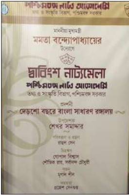
নাট্যচক্রের ‘এসো নাটক শিখি’। ১২ মার্চ একটিমাত্র নাটক মঞ্চস্থ হয়। নাটকটি ছিল কোচবিহার কম্পাসের ‘দেওয়ান গাজীর কিসসা’। ১৩ তারিখ মঞ্চস্থ হয় জলপাইগুড়ি উদীচীর ‘অজ্ঞাত আততায়ী’। ১৪ মার্চ তিনটি নাটক মঞ্চস্থ হয়। প্রথমে মঞ্চস্থ হয় জলপাইগুড়ি অনামী থিয়েটার সেন্টারের ‘হারানো প্রাপ্তি’। এরপর যান্ত্রিক নাট্যগোষ্ঠী কালিয়াগঞ্জ