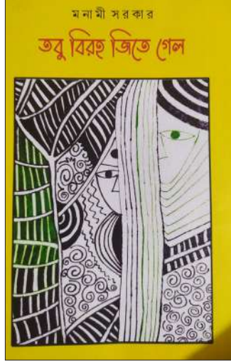
ফসলের মত বর্তমানের স্মৃতিতে থেকে যায়। এখন আমার কষ্ট আর কষ্ট হয়না, নেই কোন যন্ত্রণা। ‘ভালো আছি আমি’ কবিতার এই লাইনে কি সুন্দর বলেছেন

এপ্রেমের ব্যর্থতা শুধু মানব-মানবীর নয়। কৃষকের চাষের জমির ফসলের মধ্যেও গড়ে ওঠে প্রেম। কিন্তু হেমন্তে ফসল তুলে ফেলার পর সেই শূন্য মাঠও যে ব্যর্থ প্রেমের কথা বলে তা অসাধারণ উপলব্ধি কবির। পূর্ণিমার চাঁদের উপর ঘনিষ্ঠে আসতে দেখেছে গ্রহণ কে কবি। এমনি কিছু লাইনের মধ্যে দিয়ে জীবনের অন্ধকার সময়ের কথাও তিনি মনে রাখতে চেয়েছেন। কারন আলো অন্ধকার দুই নিয়েই জীবন। ভালোবাসলে ছাড়তে জানতে হয়। তাঁর ‘তাগ’ কবিতার এই লাইনটি মনে করিয়ে দেয় জীবনের চিরন্তন সত্যকে যে ভালোবাসা মানে তাগও। যেমন মানুষকে ভালোবেসে সংসার তাগ করে কৃচ্ছসাধন কে পথ হিসেবে নিয়েছিলেন গৌতম বুদ্ধ। কুয়াশার চাদরে ঢাকা পড়বে সব জানি/ খুঁজে দেখো তবু ওখানে হৃদয়ের ফসল ঠিক খুঁজে পাবে। কি অসাধারণ কথা এই লাইনের মধ্যে দিয়ে বুঝিয়েছেন তিনি সারসত্য। আসলে সব কিছু ইতিহাস হয়ে গেলেও