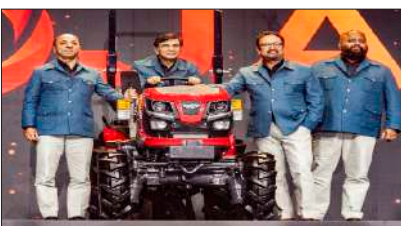
প্ল্যাটফর্মে। এই মডেলগুলির রেঞ্জ ২০এইচপি থেকে ৪০এইচপি।

নতুন দিল্লি: দক্ষিণ আফ্রিকার কেপ টাউনে ফিউচারস্কেপ অনুষ্ঠানে মাহিন্দ্রা গ্রুপের মাহিন্দ্রা ট্রাক্টর্স লঞ্চ করল তাদের ফিউচার-রেডি রেঞ্জের ট্রাক্টর - 'মাহিন্দ্রা ওজ' (Mahindra OJA)। 'ওজ' হল মাহিন্দ্রার গ্লোবাল লাইটওয়েট ট্রাক্টর প্ল্যাটফর্ম। এটি নির্মিত হয়েছে মাহিন্দ্রা রিসার্চ ভ্যালি (ইন্ডিয়া), আর-অ্যান্ড-ডি সেন্টার ফর মাহিন্দ্রা এএফএস এবং মিৎসুবিশি মাহিন্দ্রা এগ্রিকালচার মেশিনারি'র (জাপান) সম্মিলিত উদ্যোগে। এজন্য বিনিয়োগ করা হয়েছে ১২০০ কোটি টাকা। লাইটওয়েট ৪ডব্লিউডি ট্রাক্টর ডিজাইন ও ইঞ্জিনিয়ারিংয়ে পরিবর্তন ঘটিয়ে ট্রাক্টর টেকনোলজিতে যুগান্তকারী উদ্ভাবন হিসেবে এসেছে মাহিন্দ্রা ওজ ট্রাক্টর। কেপটাউনে মাহিন্দ্রা তাদের নতুন ট্রাক্টর উপস্থিত করেছে ৩টি ওজ প্ল্যাটফর্মে - সাব-কমপ্যাক্ট, কমপ্যাক্ট ও স্মল ইউটিলিটি প্ল্যাটফর্মে। ৪ডব্লিউডি'কে স্ট্যান্ডার্ড করে ভারতের বাজারে মাহিন্দ্রা লঞ্চ করেছে ৭টি নতুন ট্রাক্টর মডেল - কমপ্যাক্ট ও স্মল ইউটিলিটি