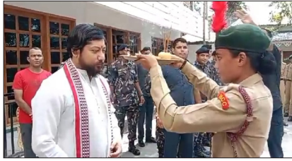
মিস্ত্রিমুখ করান কেন্দ্রীয় স্বরাষ্ট্র প্রতিমন্ত্রী নিশীথ প্রামাণিক।

নিজস্ব সংবাদদাতা, কোচবিহার: ভেটাগুড়িতে কেন্দ্রীয় স্বরাষ্ট্র প্রতিমন্ত্রীর নিজ বাসভবনে রাখীবন্ধন উৎসব পালন ১৩ বেঙ্গল এনসিসি ক্যাডেটদের। বুধবার দুপুর বারোটা নাগাদ ভেটাগুড়িতে কেন্দ্রীয় স্বরাষ্ট্র প্রতিমন্ত্রী নিশীথ প্রামাণিককে রাখী পরিষে এই দিনটি সাড়ম্বরে পালন করল ১৩ বেঙ্গল এনসিসি ক্যাডেটের মেয়েরা। এদিন প্রথমে কেন্দ্রীয় প্রতিমন্ত্রীর বরণ করে নিয়ে তারপর তার হাতে রাখী পড়ায় বেঙ্গল এনসিসি ক্যাডেটের মেয়েরা। রাখীবন্ধন উৎসব শেষে সকলকে