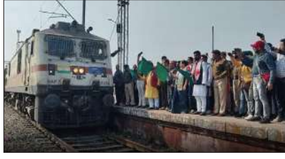
ধন্যবাদ জানাই এই উপহার দেওয়ার জন্য। আলুয়াবাড়ি স্টেশনে ক্যাপিটাল এক্সপ্রেসের স্টপেজ চালু হওয়ায় খুশি উত্তর দিনাজপুর জেলার বাসিন্দারা।

নিজস্ব সংবাদদাতা, উত্তর দিনাজপুর: উত্তর দিনাজপুর জেলার আলুয়াবাড়ি স্টেশনে ক্যাপিটাল এক্সপ্রেসের স্টপেজের আনুষ্ঠানিক উদ্বোধন করা হলো আজ। বৃহবার উত্তর-পূর্ব সীমান্ত রেলওয়ের কাটিহার ডিভিশন আয়োজিত আলুয়াবাড়ি স্টেশনে একটি অনুষ্ঠানের মাধ্যমে এই ক্যাপিটাল এক্সপ্রেসের স্টপেজের উদ্বোধন করেন রায়গঞ্জের সাংসদ তথা কেন্দ্রীয় নারী ও শিশু কল্যাণ প্রতিমন্ত্রী দেবশ্রী চৌধুরী। সাংসদ দেবশ্রী চৌধুরী বলেন, দীর্ঘদিন থেকে চেষ্টা ছিল আলুয়াবাড়ি স্টেশনে ক্যাপিটাল এক্সপ্রেসের একটি স্টপেজের, প্রধানমন্ত্রী নরেন্দ্র মোদিজি ও রেলমন্ত্রীকে