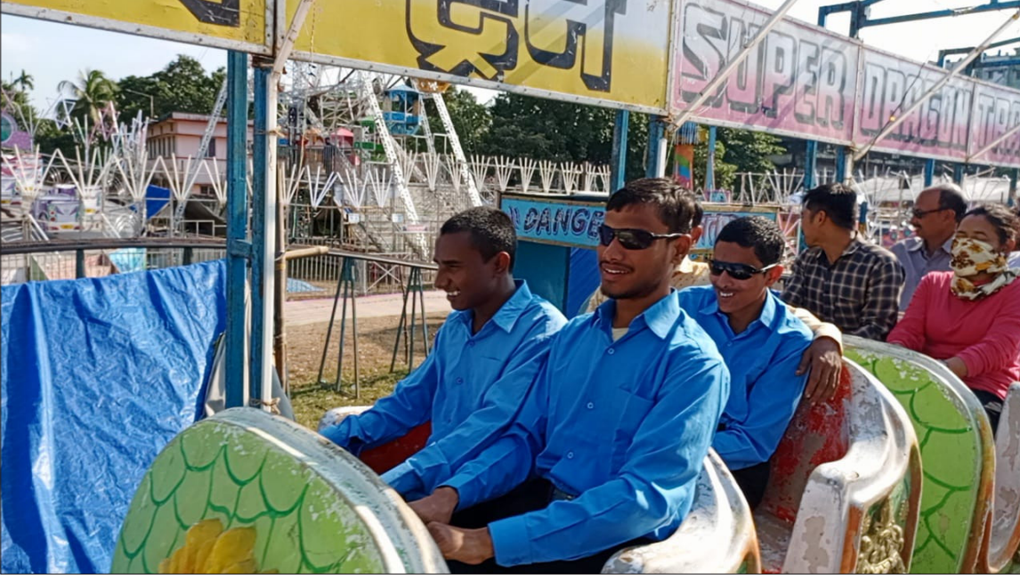
রাসমেলায় আনন্দে বিশেষভাবে সক্ষম বাচ্চারা